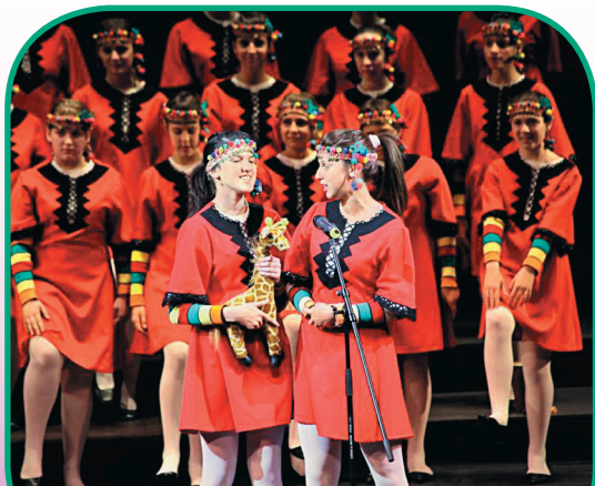
Фото: Международный хоровой фестиваль в Санкт-Петербурге

Репертуарный диапазон фестиваля простирается от джаза и рока до классики и духовной музыки,