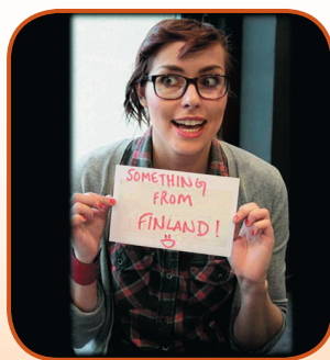
Фото: Кампус-фестиваль г. Миккели

Фестиваль является также частью маркетинговой стратегии Университета прикладных наук Миккели. Событие привлекает потенциальных студентов и будущих партнеров университета. Методика Миккели способствует развитию сотрудничества между всеми организациями города, а Университету помогает получить статус координатора сообщества культурных учреждений региона Южного Саво.