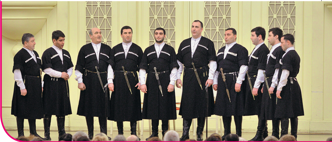
Фото: Международный хоровой фестиваль в Санкт-Петербурге

на фестивале регулярно звучат сочинения крупнейших современных композиторов — Софии Губайдулиной, Родиона Щедрина, Арво Пярта. Фестиваль выпускает собственную аудио- и видеопродукцию, а его центральное событие — грандиозный гала-концерт в День России — ежегодно собирает до 10 000 слушателей. Большинство концертов фестиваля проходит в больших залах на общедоступной основе и зачастую на открытых площадках, что дает возможность охватить самую широкую аудиторию, в том числе публику из малообеспеченных слоев населения.