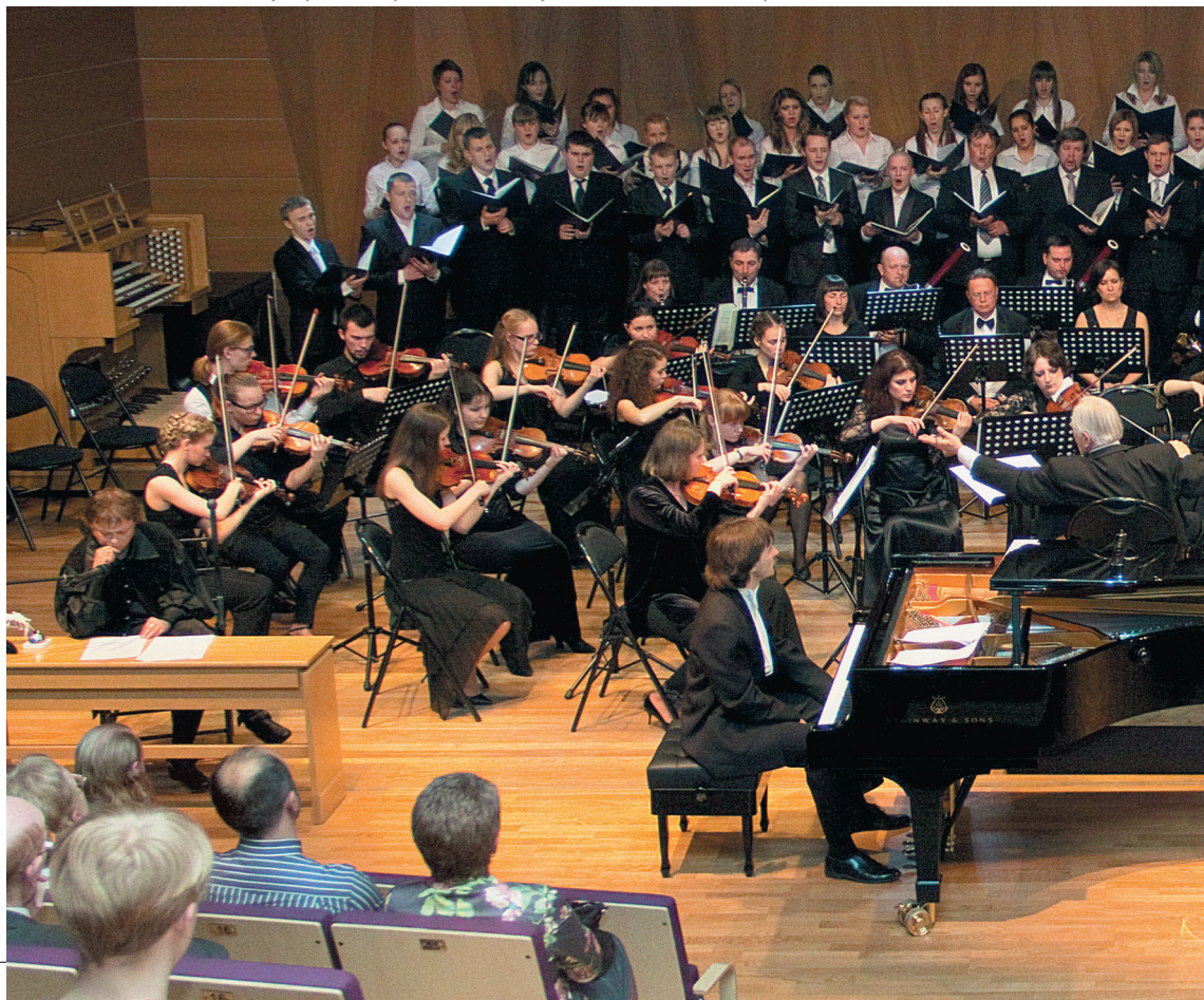
Фото: Международный фестиваль искусств «Белые ночи Карелии»

Фестиваль стремится расширять свои творческие и жанровые границы. Его обязательно сопровождают художественные выставки. Специально для VIII фестиваля был поставлен спектакль Национального театра Карелии «Ходари». В дальнейшем планируется участие в фестивале музеев и театров Петрозаводска, а также проведение некоторых проектов в районах Карелии.