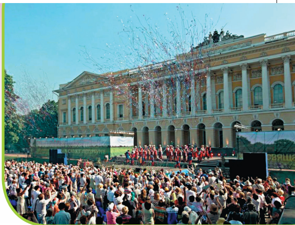
Фото: Международный хоровой фестиваль в Санкт-Петербурге

православной музыки». В течение трех недель у «академистов» из разных стран есть возможность погрузиться в богатый и все еще малоизученный мир аутентичной русской культуры. В рамках фестиваля можно на практике познакомиться с подлинными образцами древнерусского певческого искусства, посмотреть старинные рукописи, хранящиеся в петербургских библиотеках, встретиться с учеными-медиевистами и известными дирижерами, возрождающими аутентичное церковное пение. На фестивале представлено все многообразие православной духовной музыки, как русской, так и византийской, сербской, грузинской и даже коптской.