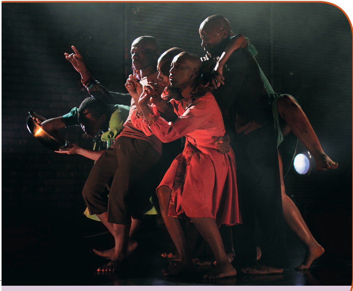
Vuyani Dance Theare (South Africa)

Дополнительная информация: www.festivals.fi