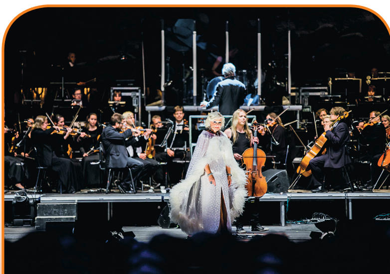
Pyhäniemi Manor

◀ Vekara-Varkaus Children's Summer Festival